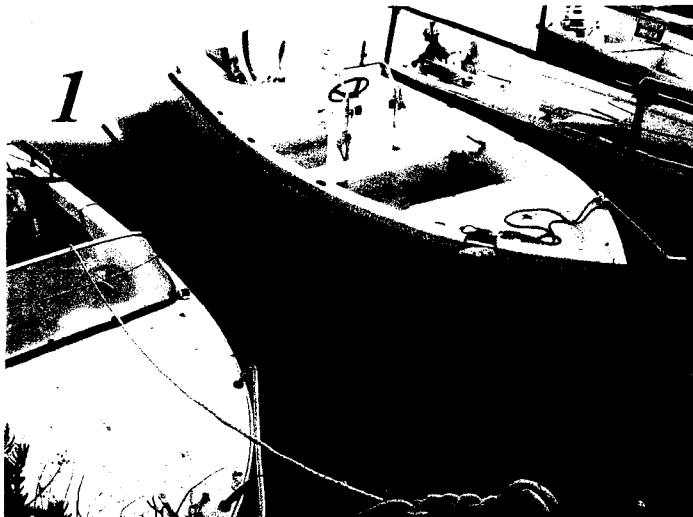
Lato sx guardando da via Varese (fine fosso)